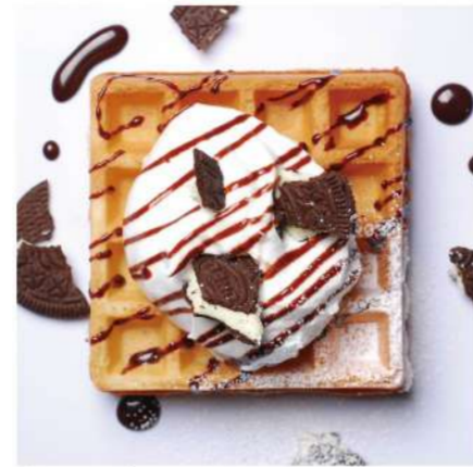
3. クリーム &チョコソース