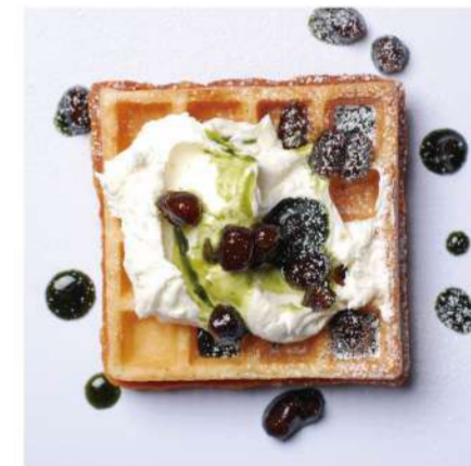
18. レアチーズクリーム &抹茶あずきソース