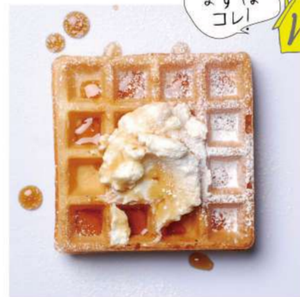
14. 塩キャラメルバター &メープルシロップ