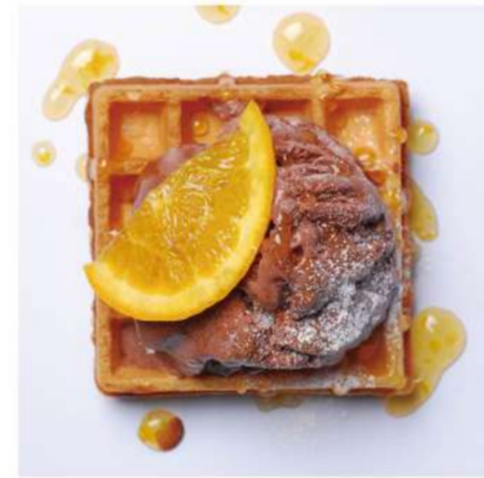
10. チョコアイス &オレンジソース