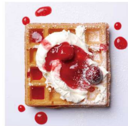
16. レアチーズクリーム &ベリーソース