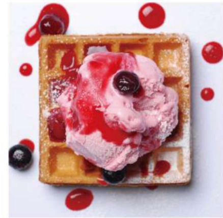
7. ストロベリーアイス &ベリーソース