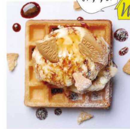
12. バニラアイス &モカソース