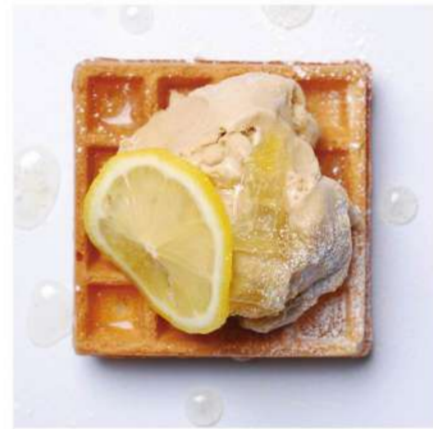
8. 紅茶アイス &レモンソース