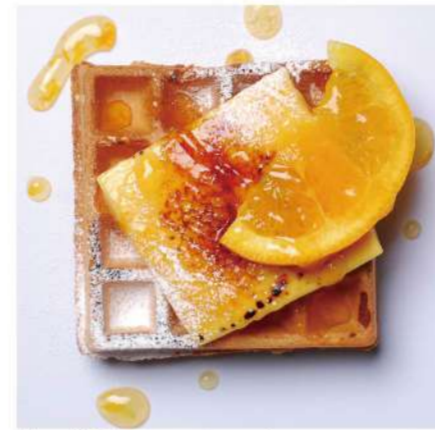
4. 焼きカスタード &オレンジソース