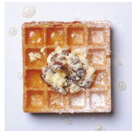
15. レーズンバター &はちみつ