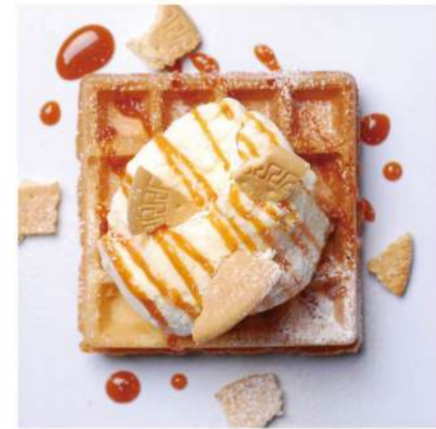
11. バニラアイス &生キャラメルソース