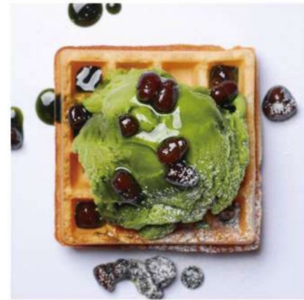
9. 抹茶アイス &あずきソース