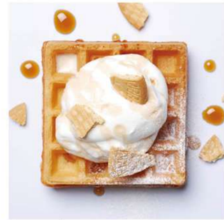
1. クリーム &メープルシロップ