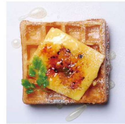
6. 焼きカスタード &はちみつ