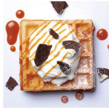
2. クリーム &生キャラメルソース