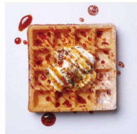
13. あずきバター&黒みつ