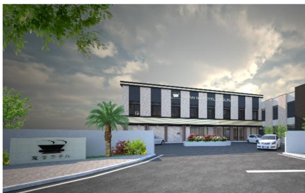
▲ホテル外観イメージ