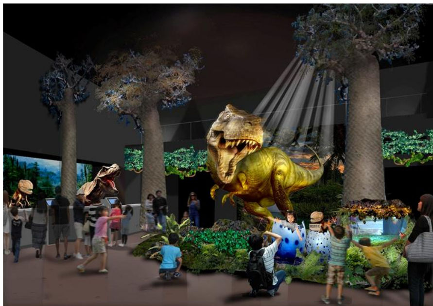
▲ホテルフロントイメージ

また、ホテル内のレストランは、「癒し」と「食」をテーマにした複合温泉リゾート施設「アクアイグニス」を運営する株式会社アクアイグニスの手掛けます。当ホテル同様「変化・進化し続ける」をコンセプトに、伊・仏・和・中の有名シェフが順番に料理のプロデュースをしていきます。