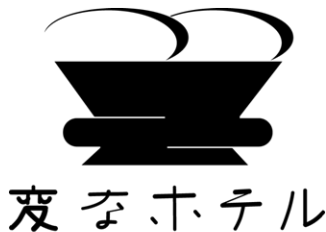
変わり続けることを約束するホテル