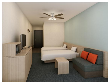
▲スタンダードツインイメージ

予約サイトURL： http://www.h-n-h.jp/lagunatenbosch/