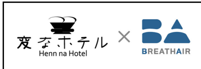
▲変なホテル×ブレスエアー®

※2「ブレスエアー®」とは、耐久性に優れた洗えるクッション材。96%が空気層で、通気性、クッション性能、透水性、耐久性、環境・安全、制菌性能に優れ、快適爽快。ブレスエアー®を使用した敷布団や枕は、ムレにくく寝返りがうちやすく、いつまでも寝ていられるような快適な寝心地を提供。シート材の分野では、高い耐久性が要求される新幹線 N700 系をはじめとする各鉄道シートや自動二輪シートにも採用。