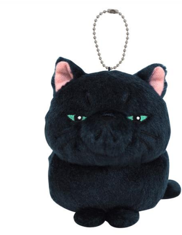
▲ポンポンキーホルダー（ティブ&ギブガエル）