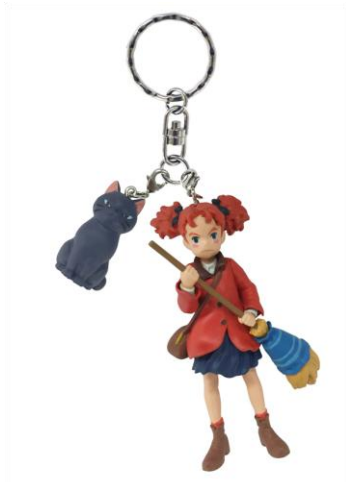
▲キーリング（メアリとティブ）