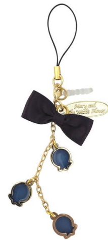
▲夜間飛行ストラップ