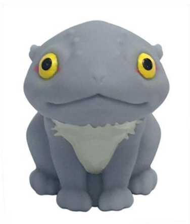
▲ギブガエル指人形（イベントオリジナル）