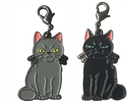
▲メタルチャームコレクション（ギブ&ティブ）

<このリリースに関するお問い合わせ> 株式会社ラグーナテンボス（広報担当）近藤・青柳