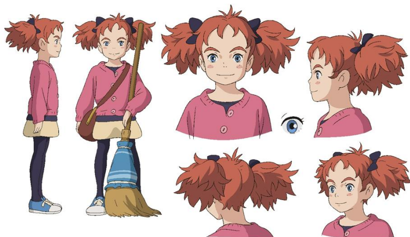
▲主人公メアリ設定資料