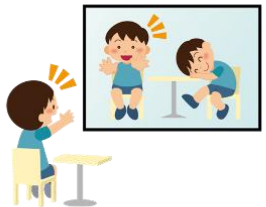
▲ARミラー(イメージイラスト)