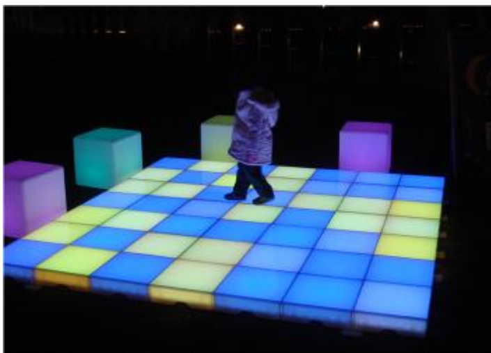
▲シャイニングフロアー