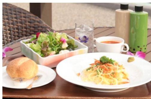
▲（写真中央）桜えびと菜の花のクリームパスタ （写真右上）ラグーナの森 LATTE

春の花々を鑑賞しながら、食事が出来るカフェレストラン ラグーナの森では、桜えびと菜の花を使用した「桜えびと菜の花のクリームパスタ」（1,600円）と、2種類の味が楽しめる「ラグーナの森LATTE」（600円）を販売します。