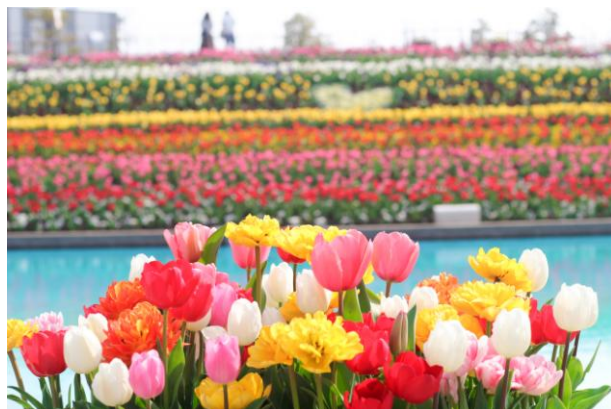
▲昨年度開催のチューリップまつりの様子