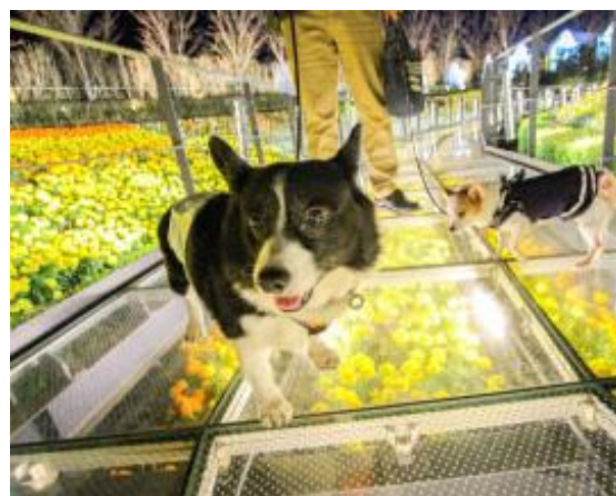
▲フラワーラグーン ※過去開催時の様子