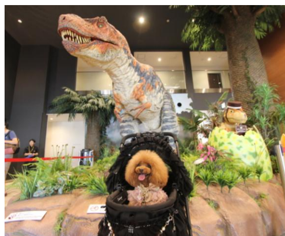
▲愛犬と一緒に泊まれる「ドッグルーム」がある 「変なホテル ラグーナテンボス」 ※過去開催時の様子