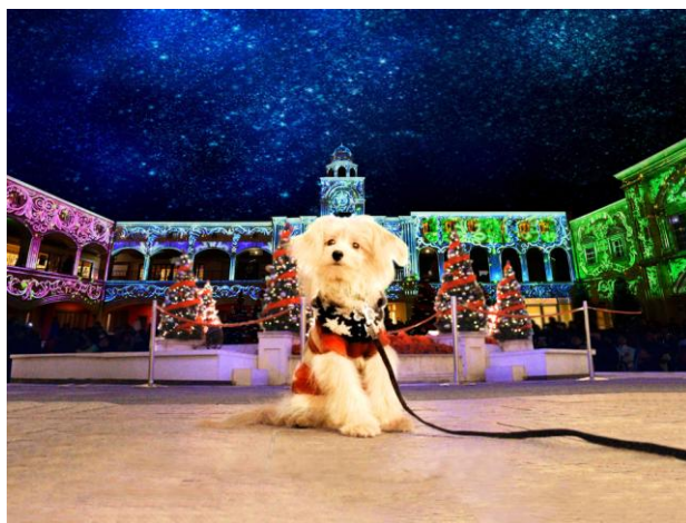
▲わんわん冬ラグーナ ※イメージ

本イベントは、ラグナシアで11月2日（土）より開催する冬季イベント「史上最光の冬ラグーナ」を愛犬・愛猫と一緒に楽しみいただけるイベントです。イベント期間中、写真映え抜群のわんわん冬ラグーナ専用「光のフォトスポット」やイルミネーションが輝く「光のドッグラン」などが新登場します。