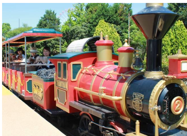
▲愛犬と一緒に乗れるアトラクション 「トレイントレイン」 ※過去開催時の様子