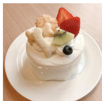
わんわんケーキ ※イメージ