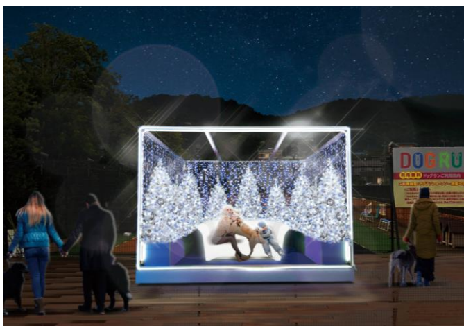
▲新登場するわんわん冬ラグーナ専用「光のフォトスポット」 ※画像はイメージです

株式会社ラグーナテンボス（所在地：愛知県蒲郡市、代表取締役社長：巽 泰弘）は、運営するテーマパークのラグナシアにて、冬季イベント「史上最光の冬ラグーナ」を愛犬と一緒に楽しめる「わんわん冬ラグーナ 2019」を11月2日（土）より開催致します。