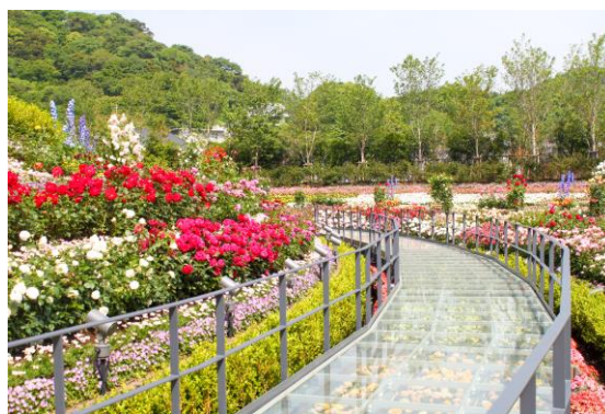
▲過去開催のバラまつりの様子