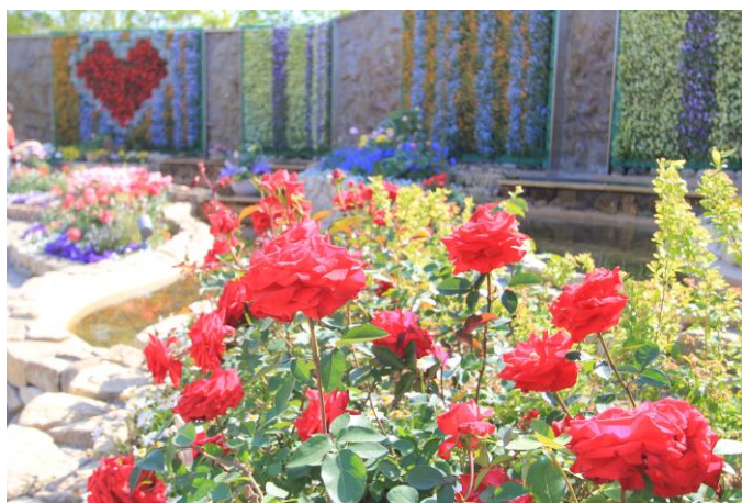
▲過去開催のバラまつりの様子

今年の「ラグーナテンボス バラまつり」では、バラの国際大会で金メダル受賞歴のあるバラを世界各国から集め、3年に1度開催されるバラの国際大会ともいわれる「世界バラ会議」で「バラの殿堂」として世界から認められた品種もご覧いただけます。その他にも聖火台に灯る炎をイメージして、日本で作出されたバラ「聖火」や国内初お披露目となるバラ「soul」など厳選した品種を展示いたします。