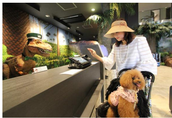
▲変なホテル「ドッグルーム」