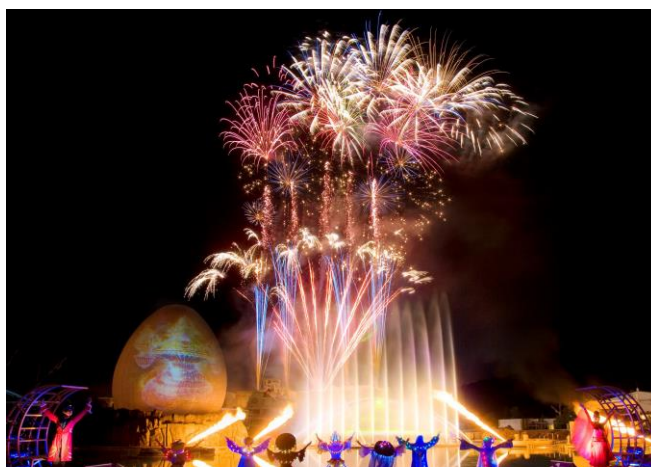
▲花火スペクタキュラ「ミスティノーチェ」 ※画像はイメージです。実際の演出と異なる場合がございます。