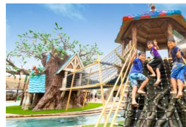
▲ジュラグーン イメージ画像