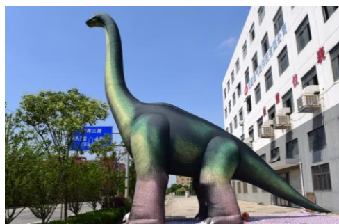
▲スーパーサウルス イメージ画像

一昨年より「ジュラグーン」として運営していたキッズプールに新たなプールアトラクション「ジュラ★サマー」が登場いたします。体長14mを誇る「スーパーサウルス」と恐竜の口からウォーターライダーを滑り降りる「ギガ・ヘッド」の2体の恐竜ふわふわ遊具を水着のままお楽しみいただけます。