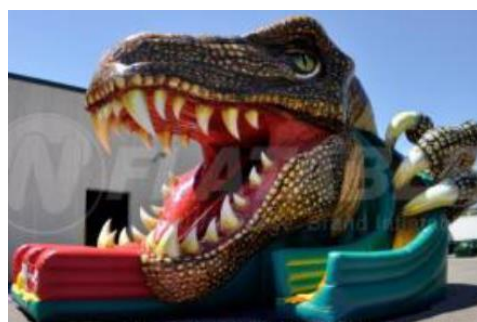
▲ギガ・ヘッド イメージ画像