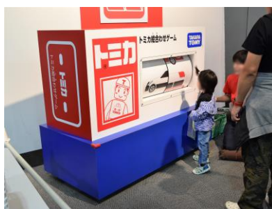
▲トミカ絵合わせゲーム