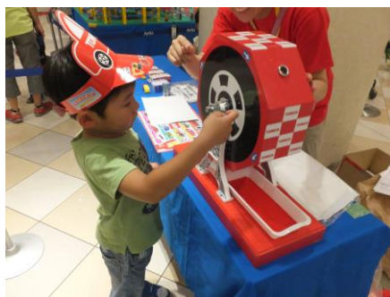
▲トミカおでかけスタンプラリー