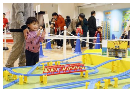
▲プラレールタワー車庫入れゲーム