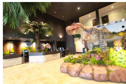
▲変なホテル ラグーナテンボス イメージ

④「トミカ・プラレールフェスティバル in ラグーナテンボス 2022」イベント入場券