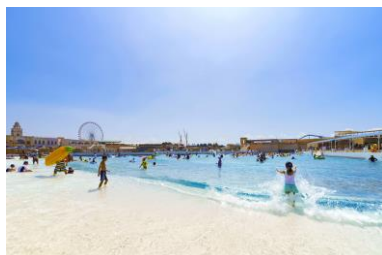
日本最大級 最大波高 1m の波が出るプール 「ジョイアマーレの浜辺」