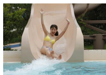
地上約 15m から回転しながら滑るウォータースライダー 「ゼウスの稲妻」