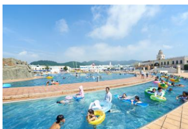
幅広い年齢が楽しめるラグナシア定番 全長 230m の流れるプール 「ウロボロスの河」