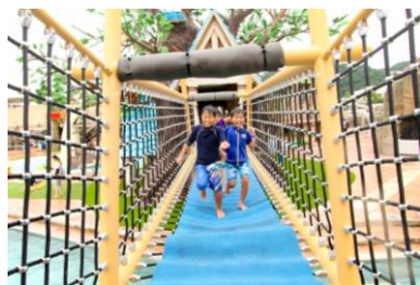
プールの中に恐竜が現れた楽しい仕掛け満載のキッズプール 「ジュラグリーン」