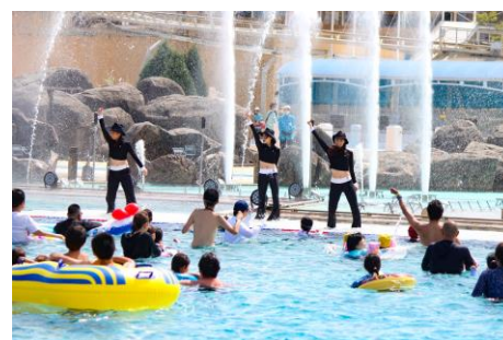
▲スプラッシュ ビクス