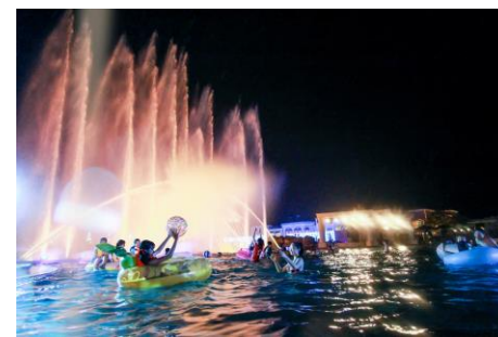
▲スプラッシュ ビーツ ファウンテン