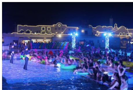
▲スプラッシュ ビーツ