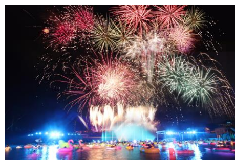
▲花火スペクタキュラ「フレイム」