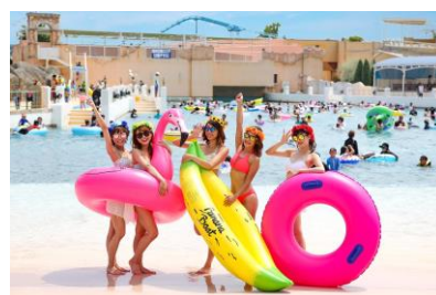
▲浮き輪フリーパス