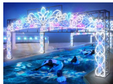
▲ナイトプールエリア拡大 「ウロボロスの河」