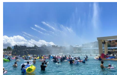
▲スプラッシュ ファウンテン